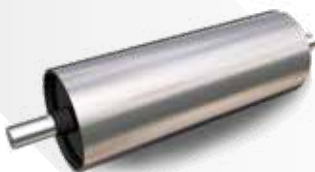
Tambor Motriz Liso