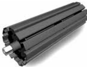
Tambor Tensor de Jaula