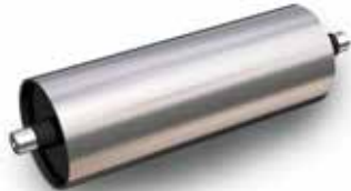
Tambor Tensor Liso