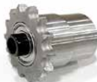
Piñones Metálicos Embutidos