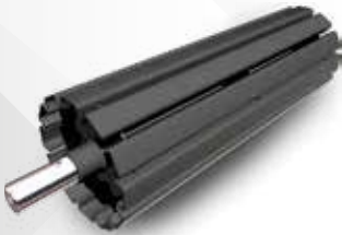
Tambor Motriz de Jaula