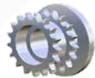
Piñones Metálicos Soldados