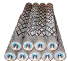
Rodillos Engomados por Autoclave